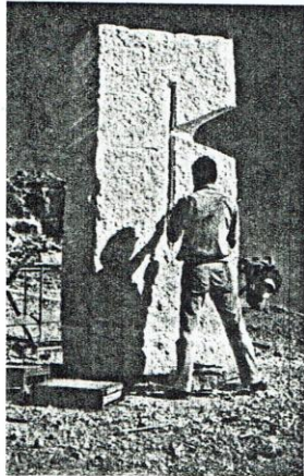
קסו אלול, ישראל